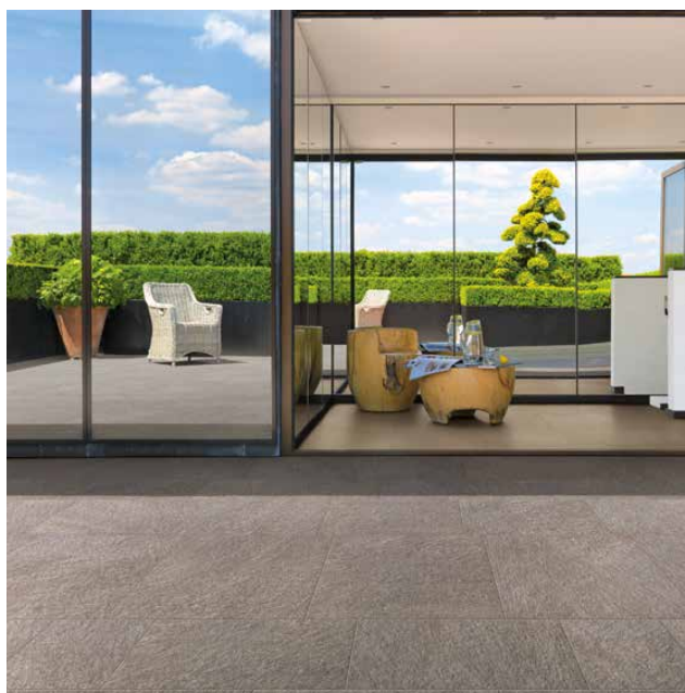
Pietra di Combe brun