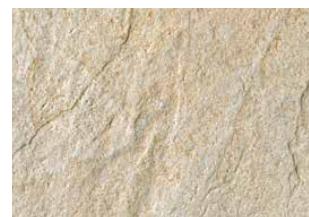
Pietra di Vals beige