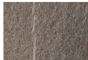
Pietra di Faedis noir