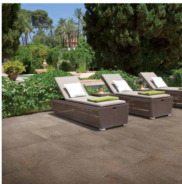
Pietra di Faedis noir