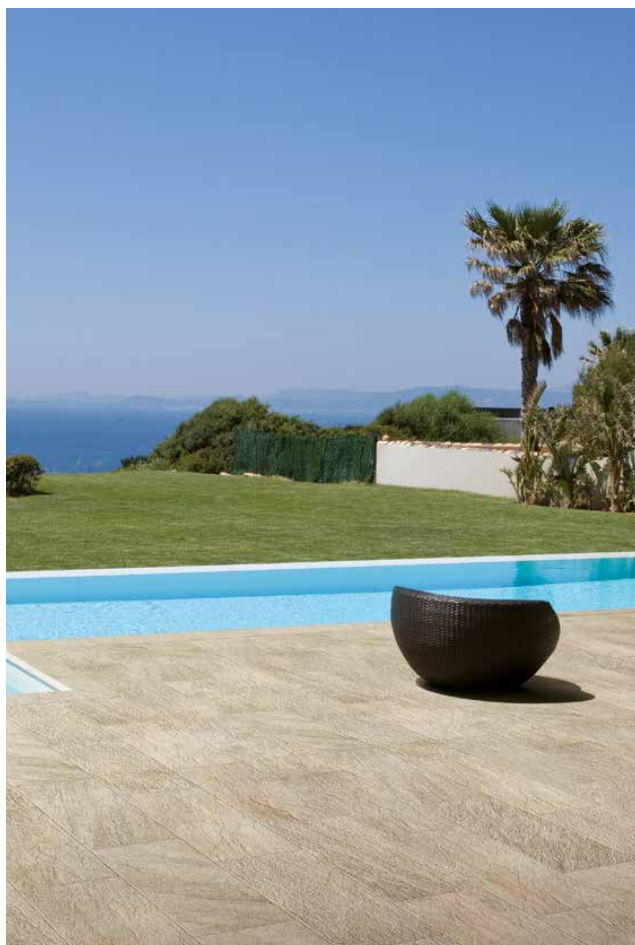
Pietra di Vals beige