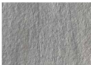
Pietra di Vals gris