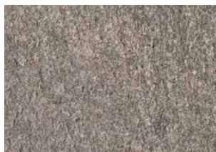
Pietra di Combe brun