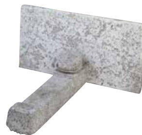
Frontplatte mit Normalanker