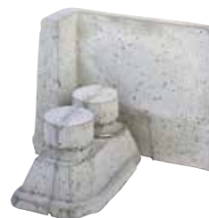
Eckstein mit Eckanker