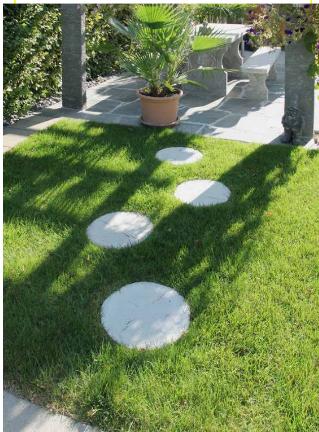
LENIA Pas japonais rond