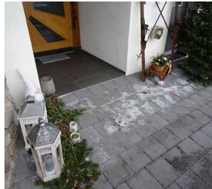
Kalkausblühungen auf jungen Betonpflastersteinen im Eingangsbereich.

Die Entstehung von Kalkausblühungen ist ein natürlicher, chemischer Prozess im Beton. Sobald Zement mit Wasser reagiert, wird Calciumhydroxid freigesetzt. Dieses ist in Wasser löslich und liegt im Porenwasser des erhärteten Betons vor. Wenn dieses im Porenwasser gelöste Calciumhydroxid mit dem Kohlendioxid aus der Umgebungsluft in Kontakt kommt, bildet sich Calciumcarbonat. Da Calciumcarbonat wasserunlöslich ist, kristallisiert es direkt an der Betonoberfläche als weisses Mineral aus – dies sind die sichtbaren Ausblühungen. Das dabei freigesetzte Wasser kann neues Calciumhydroxid aus dem Beton lösen, wodurch sich der Prozess wiederholen kann.