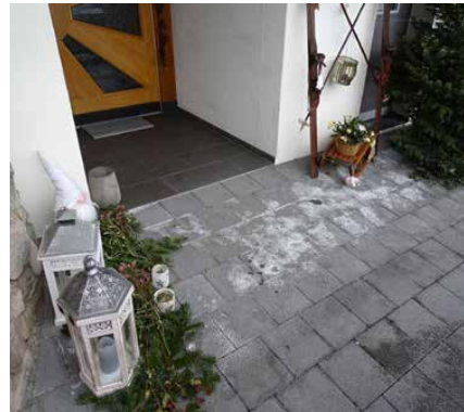
Kalkausblühungen auf jungen Betonpflastersteinen im Eingangsbereich.

Die Entstehung von Kalkausblühungen ist ein natürlicher, chemischer Prozess im Beton. Sobald Zement mit Wasser reagiert, wird Calciumhydroxid freigesetzt. Dieses ist in Wasser löslich und liegt im Porenwasser des erhärteten Betons vor. Wenn dieses im Porenwasser gelöste Calciumhydroxid mit dem Kohlendioxid aus der Umgebungsluft in Kontakt kommt, bildet sich Calciumcarbonat. Da Calciumcarbonat wasserunlöslich ist, kristallisiert es direkt an der Betonoberfläche als weisses Mineral aus – dies sind die sichtbaren Ausblühungen. Das dabei freigesetzte Wasser kann neues Calciumhydroxid aus dem Beton lösen, wodurch sich der Prozess wiederholen kann.