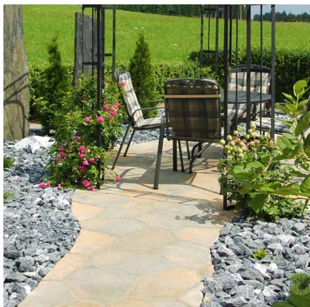
HACIENDA® CAMINOS polygonales Plattensystem